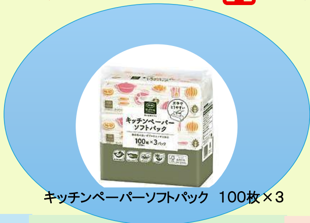
キッチンペーパーソフトパック 100枚×3