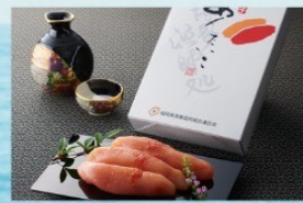
福岡無着色 辛子めんたいこ