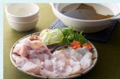
長崎県産くえ鍋セット