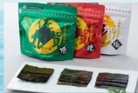
佐賀有明海産 佐賀丸