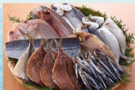
長崎俵物 干物セット