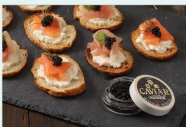
宮崎県産フレッシュキャビア

1等 10,000円相当の商品 または 10,000円分のポイント (カタログから選べます) (ギョギョいちで使えます)