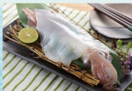
佐賀玄海呼子の 剣先いか姿造り