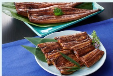
鹿児島大隅産うなぎ蒲焼セット